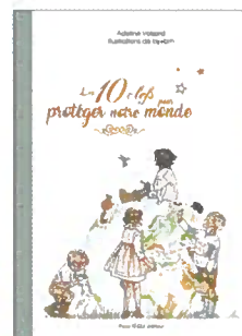
Les 10 clés pour protéger notre monde ADELINE VOIZARD - BY•BM 32 pages, relié cartonné - 14,90 €

Un beau livre aux aquarelles magnifiques qui nous fait vivre et ressentir la Terre sainte à travers le regard d'un pèlerin artiste.