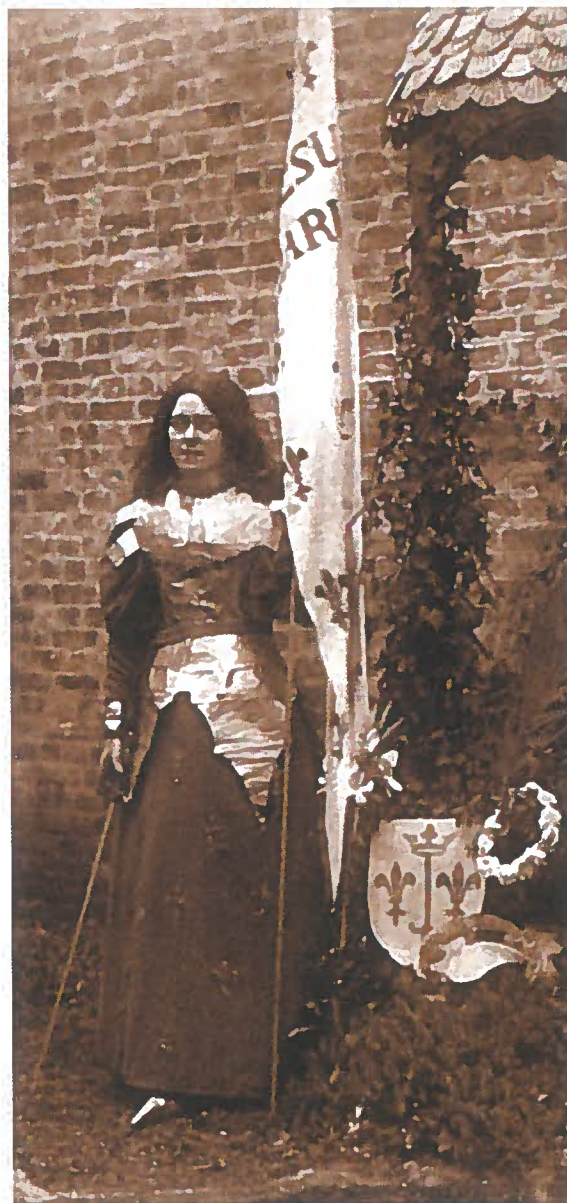
Thérèse de Lisieux est ici habillée en Jeanne d'Arc, qu'elle a jouée dans sa propre pièce Jeanne d'Arc accomplissant sa mission , le 21 janvier 1895.

Jeanne ne cesse de témoigner devant ses juges qu'elle n'a fait qu'obéir aux commandements de ses voix et que Dieu ne peut se contredire. D'où son avertissement solennel à Pierre Cauchon, évêque de Beauvais et ancien recteur de l'Université de Paris, que son âme était en grand danger !