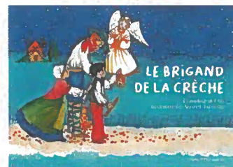
Le brigand de la crèche Conte de Noël CATHERINE DE LASCA ARMELLE TALVANDE 32 pages - 13,90 €

Les illustrations élégantes de by•bm pour 10 clés concrètes d'une vie plus humaine et respectueuse de la Création.